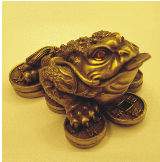
招財三腳咬錢蟾蜍

後來『劉海的妻子』回到天上，『劉海』潛心修煉，以便能成仙上天去找妻子，但天庭非常廣闊，『劉海』想起妻子非常愛錢，所以將銅錢串起做餌，以便找回妻子，果真用此方法找回妻子。